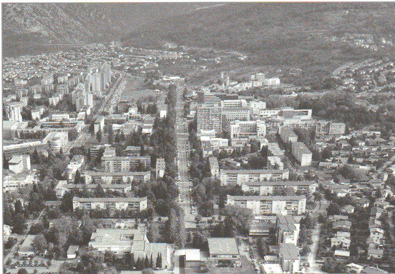
Pogled na nezaključeno magistralo