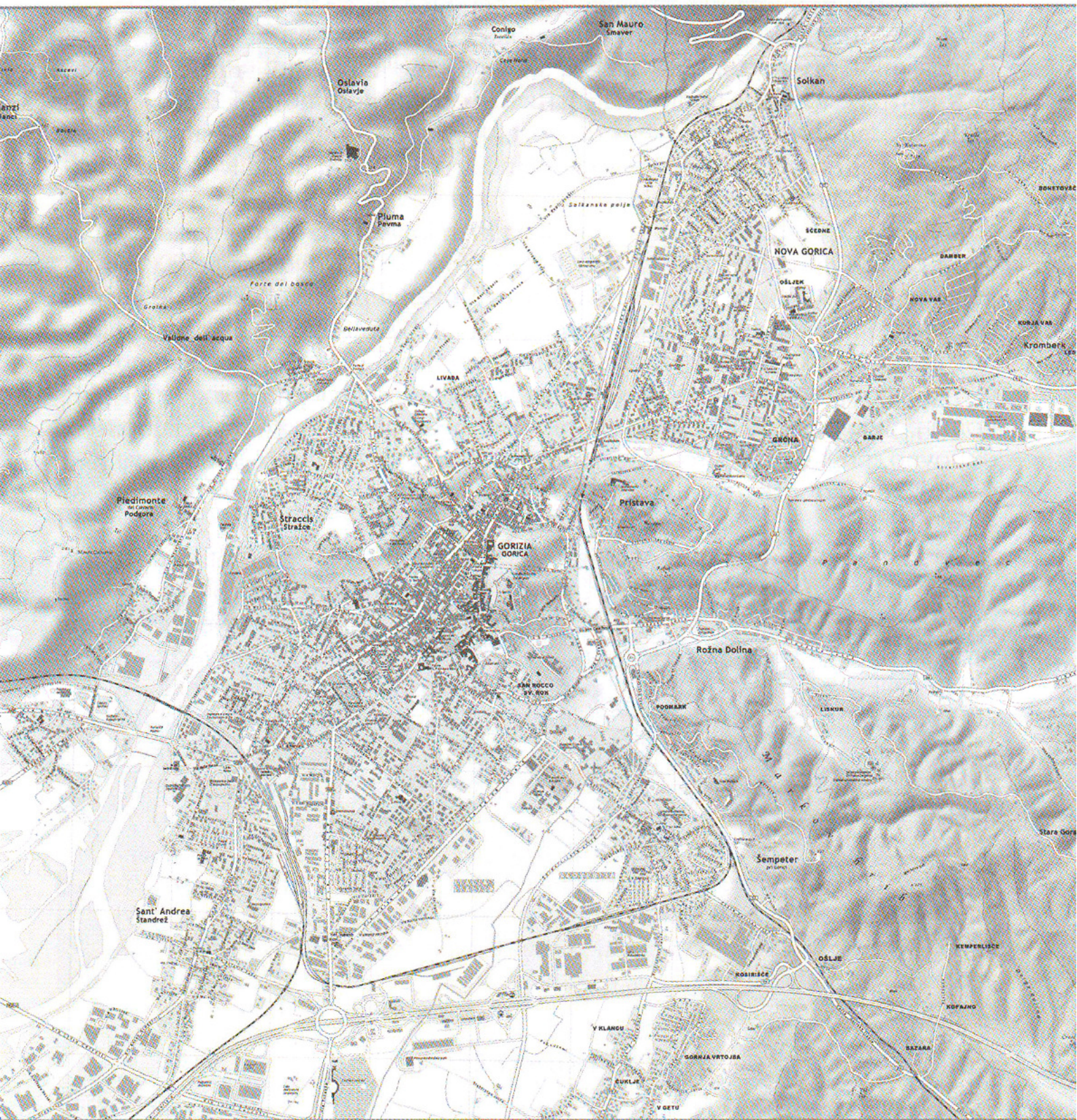
Skupna mestna karta Gorice in Nove Gorice

dovolj poživile, da ne bi bili primorani zmanjšati načrtovane naselitvene zmogljivosti. 5 Tudi na slovenski strani je bil razcvet igralništva in komercialni uspeh zaradi razlik v ceni bencina zgolj kratka zgodba o uspehu in ne dolgoročna vizija gospodarskega razvoja, ki je na nezavidljivo nizkem nivoju. Danes sta obe mesti bolj ali manj paralizirani. Tudi načrtovanje